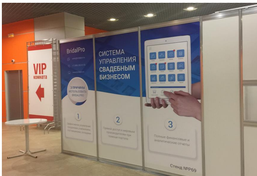
Баннер на клеевой основе при входе на выставку