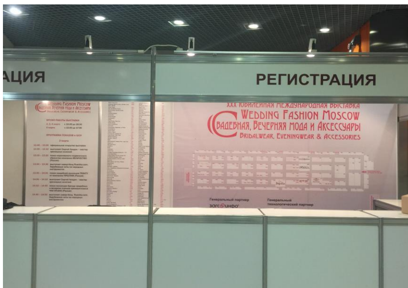
Размещение логотипа участника на схеме на стойке регистрации при входе на выставку